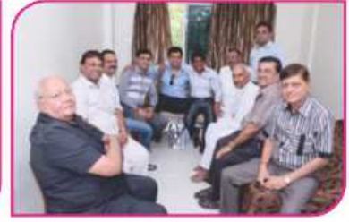
આરોગ્યધામ પરિસરમાં શ્રેષ્ઠીવર્યો