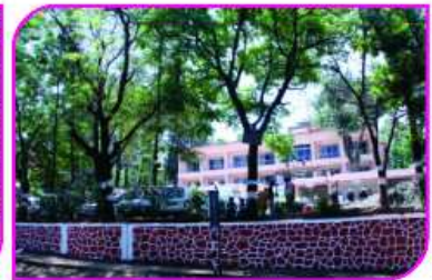
આરોગ્યધામ પ્રકલ્પની વિવિધ ઝાંખીઓ