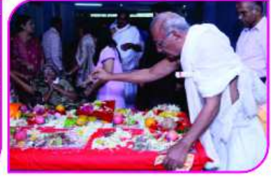
આરોગ્યધામ પરિસરમાં પ્રભુની પધરામણી અને પૂજાભક્તિ