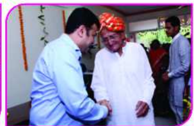
આરોગ્યધામના ઉદ્ઘાટન પ્રસંગે યતિશ્રી અને શ્રેષ્ઠીવર્યો